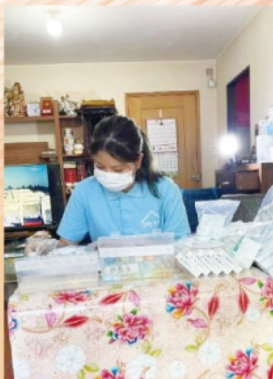
陪診後的藥物管理及教育