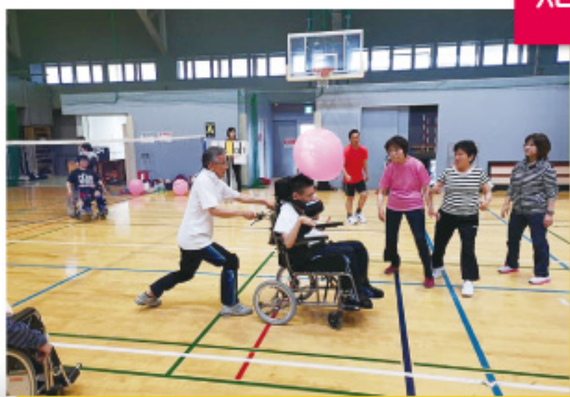
壯年男子，傷健人士，婦女，嬰兒，均可以同場參與的排球運動！