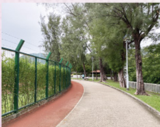
路旁種了很多樹木，偶有聽到 鳥兒的叫聲，在訓練時也倍感 舒適