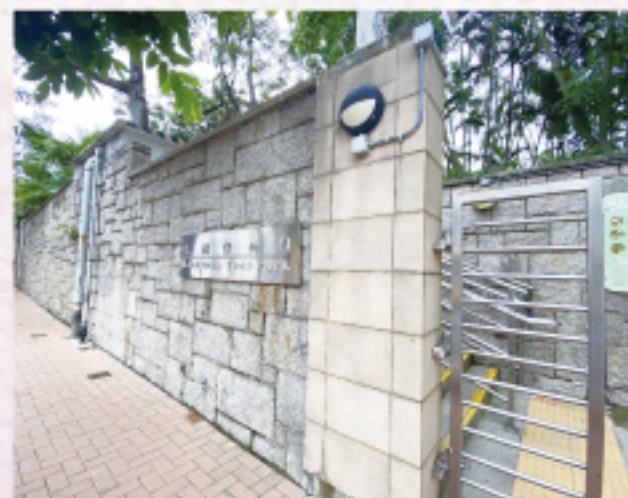
路面平坦，訓練時感到安全舒 適