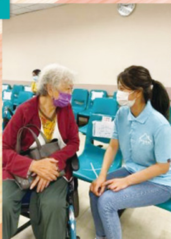
護理陪診中，與服務使用者傾談，作心靈關顧