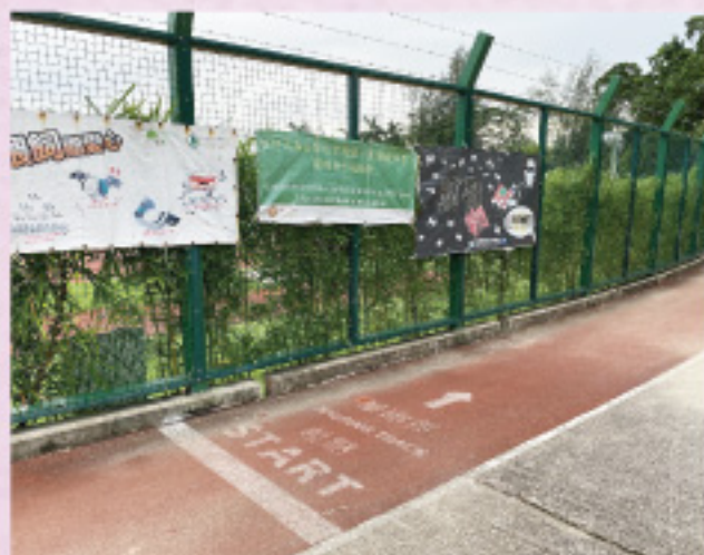
宋先生經常去的九龍仔公園， 睇下有沒有機會見到大家

工作人員向宋先生了解其心得：「在公園時，可聽到鳥兒的叫聲，又有清風和花香伴隨，令到心情得以放鬆，使他有動力練習每一步。」