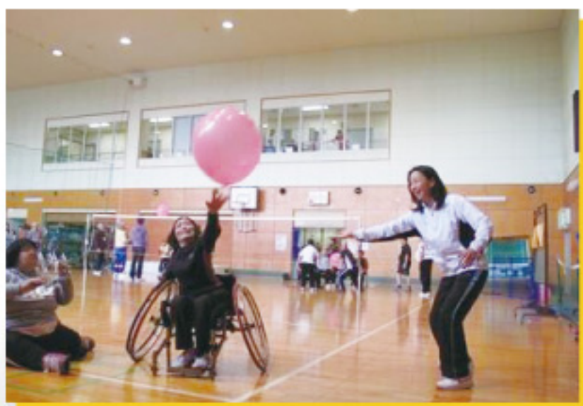
氣球運動在世界各地推廣共融