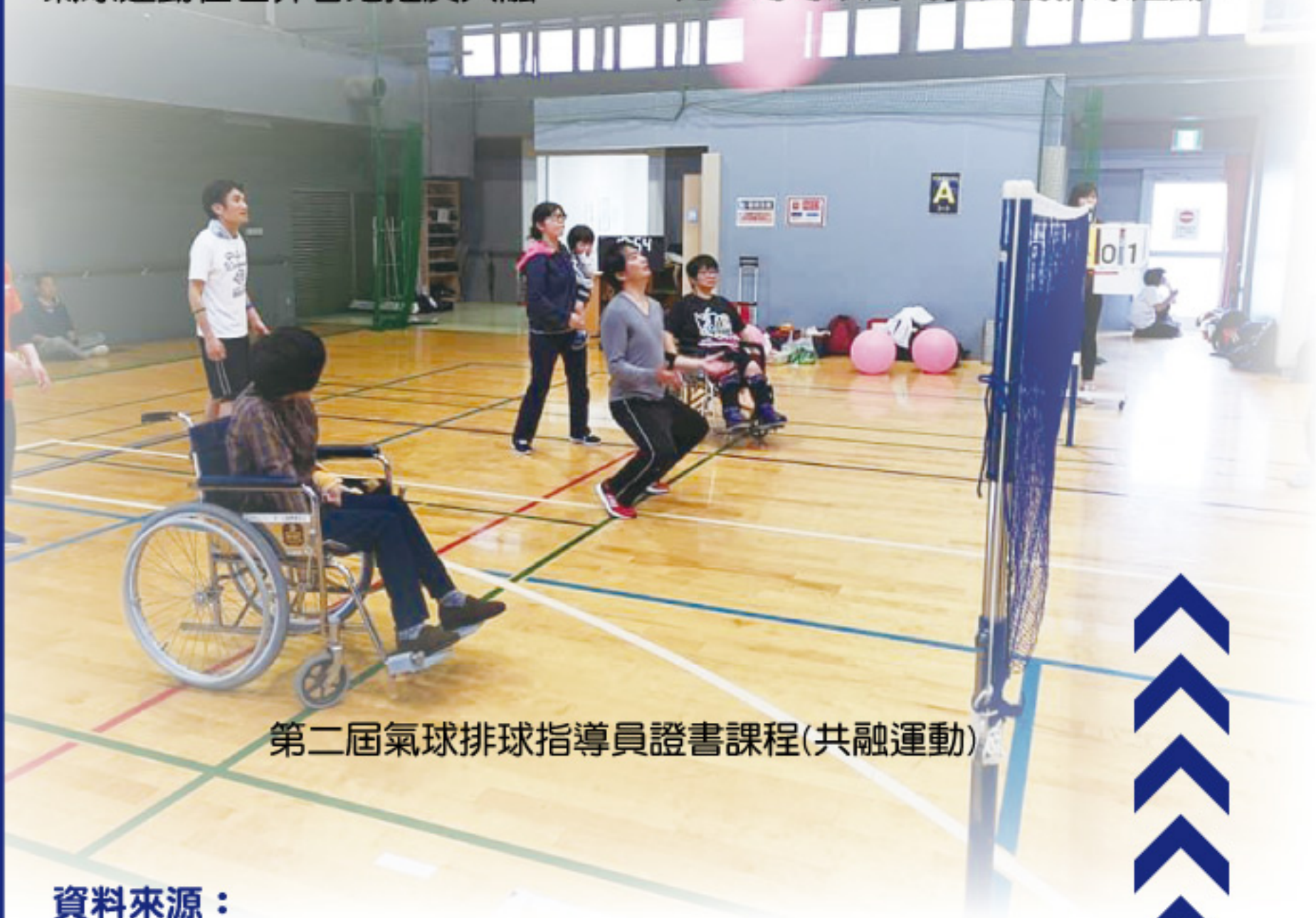
第二屆氣球排球指導員證書課程(共融運動)