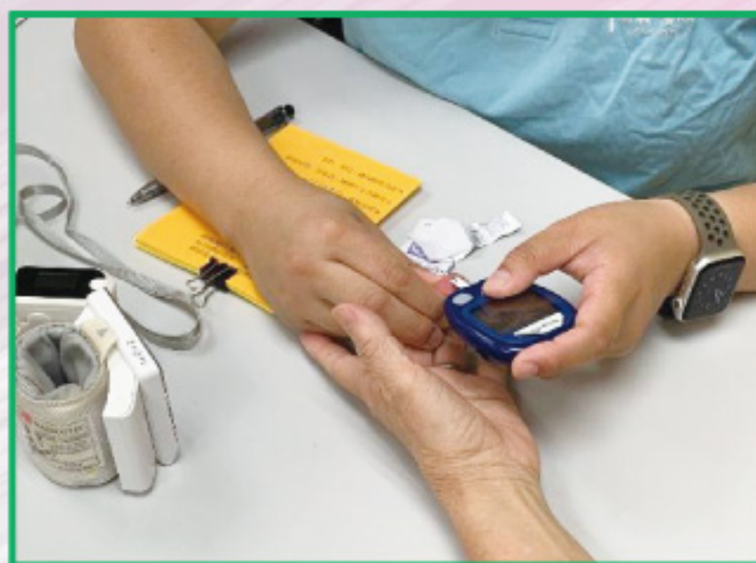
「放鬆D…」義工們提醒參加者「篤手指」驗血糖時要減輕緊張的情緒