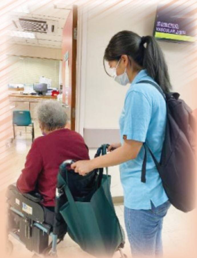
陪同服務使用者面見醫生

在每次家訪中護理部同工除了一般護理工作外，關顧服務使用者的心靈亦是重要工作的一環。護理團隊與服務使用者常相處的接觸，均容易建立感情和關係，陪伴服務使用者在康復進程上同行。當中，除了服務使用者感受到關愛外，護理團隊在工作上亦得到莫大的滿足感。