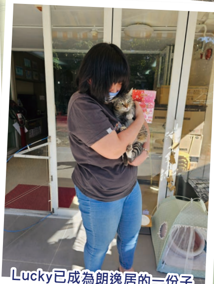
Lucky已成為朗逸居的一份子